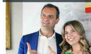
Sempre più ampia la distanza tra il sindaco e quella che sei mesi fa era stata indicata come erede naturale di de Magistris a Palazzo San Giacomo