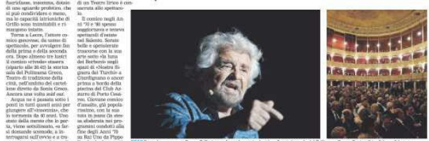
STAR Il cantore greco Beppe Grillo torna, dopo alcune tra batti, nella storica sala del Politeama Greco. Teatro di tradizione di Lecce

«L'insomnia» di Beppe Grillo Spettacolo «tutto esaurito» al Politeama Greco